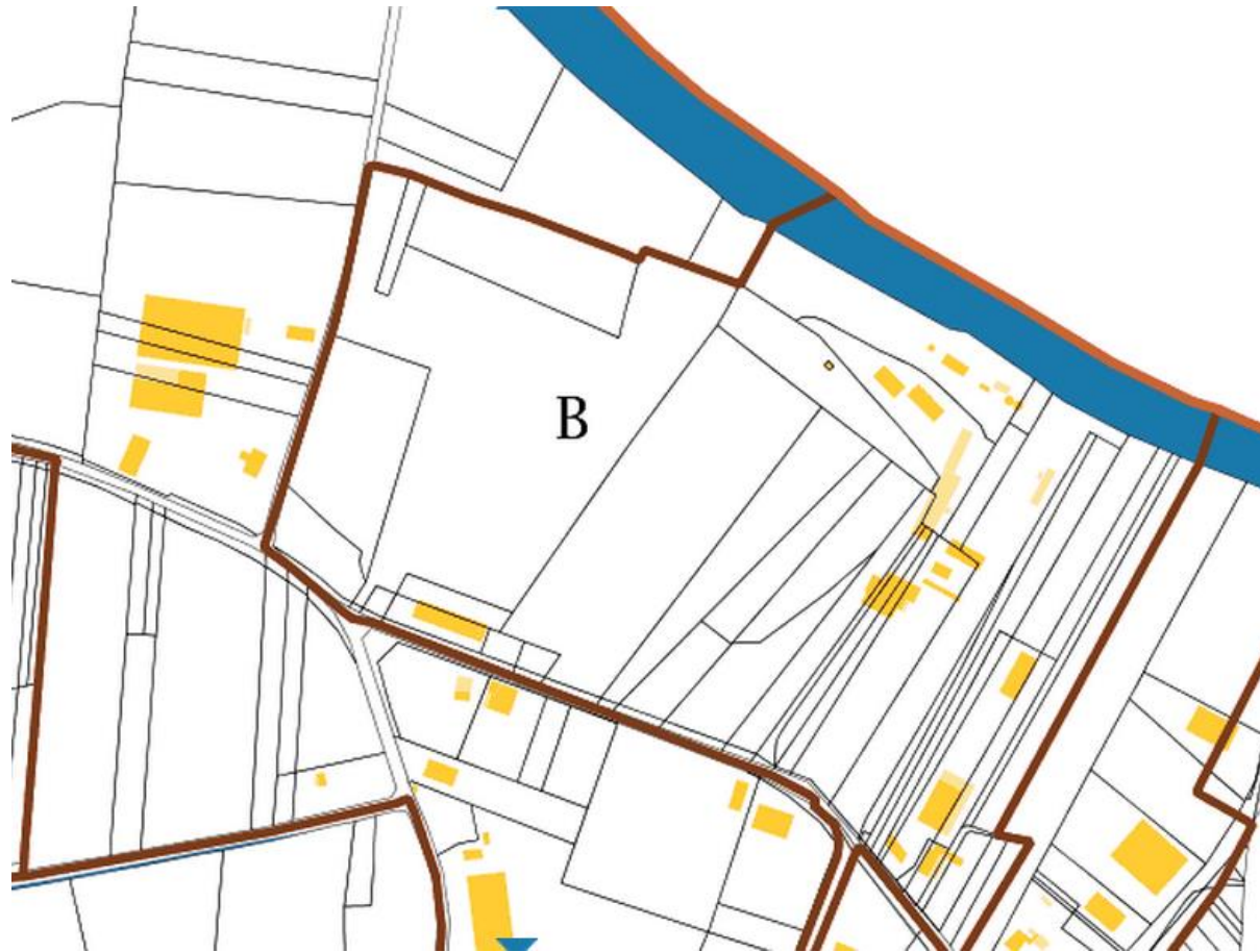
Section parcellaire de la zone d'étude