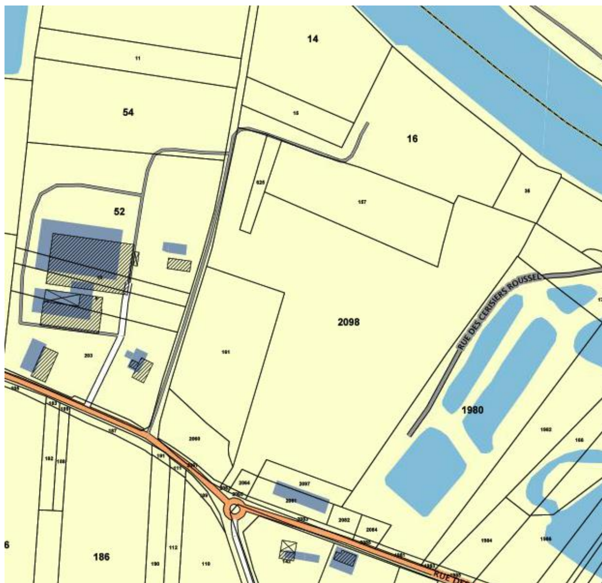
Parcelles cadastrales de la zone d'étude (n°157, 161, 625, 2060, 2062, 2064, 2081, 2082 et 2097, section B)